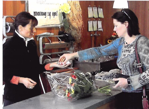
Afb. 3.26 Bij de kassa wil een klant netjes, vlot en foutloos geholpen worden.

Nadat een klant in de winkel producten heeft uitgezocht, gaat hij die producten bij de kassa betalen. Dat doet hij bij een kassamedewerker. Als kassamedewerker zorg je ervoor dat het afrekenen met de klant foutloos verloopt. Als je weet wat werken met de kassa inhoudt, weet je wat er van je verwacht wordt als een klant komt afrekenen.