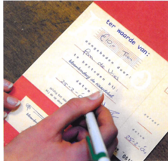
Afb. 3.31 Een klant kan ook betalen met een waardebon.

Een klant kan ook met kortings- en waardebonnen betalen. Een waardebon is een vervanger van geld. Nadat je heb afgerekend met de klant zit er geen geld in de kassa. In plaats daarvan zit er een waardebon in de kassa. Het is belangrijk dat de waardebon in de kassa zit, want anders zal er op het einde van de dag een kasverschil ontstaan. Kortingsbonnen verwerk je tijdens het betalen. Of je scant de code op de bon, zodat de korting in de kassa meteen verwerkt wordt. Of je haalt de korting zelf van de verkoopprijs af. De kortingsbonnen bewaar je niet vanwege het kasverschil, want dat is tijdens de betaling verwerkt, maar om zicht te hebben hoeveel producten met korting zijn verkocht.