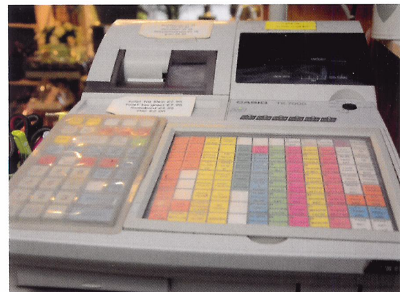
Afb. 3.27 Er zijn veel verschillende kassasystemen. In de winkel waar je werkt krijg je een persoonlijke kassatraining om te leren werken met de kassa.

Grote bedrijven werken met scankassa's die volledig geautomatiseerd zijn. De kassa's werken afzonderlijk, maar staan allemaal in verbinding met een centrale